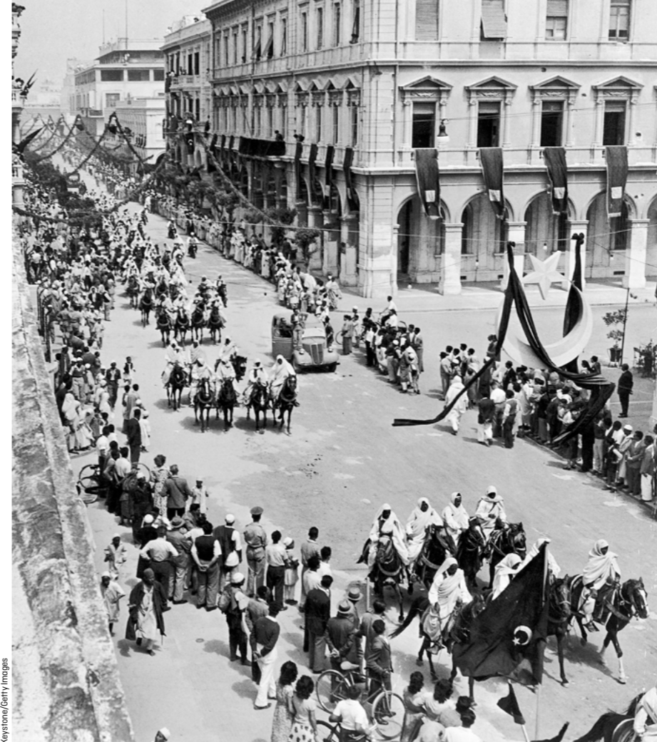
Missie geslaagd: intocht van koning Idris in Tripoli, 1951. In 1969 zette Khaddafi de Koning weer af

Adriaan Pelt krijgt de bijnaam 'de onderkoning van Libië'