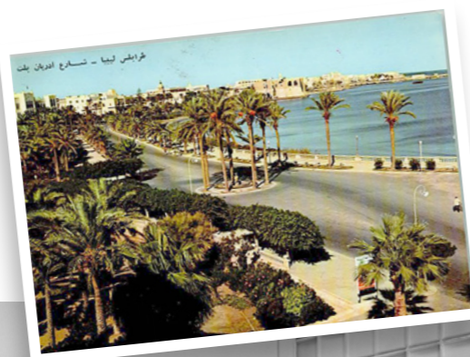
Ansichtkaart van Libië in de jaren vijftig

Niemand lijkt een einde te kunnen maken aan de burgeroorlog in Libië. Sinds Muammar al-Khaddafi er in 2011 werd verdreven, hebben vredesinitiatieven van de Verenigde Naties (VN) weinig opgeleverd. Onmachtig zich met elkaar te verzoenen, zagen Libiërs hun land afglijden en een broeinest worden van mensensmokkel en terrorisme. Maar wie Libiërs vraagt of er echt geen oplossing is, krijgt meestal een verrassend antwoord: 'Adriaan Pelt.' Wie is deze Nederlander die 36 jaar geleden is overleden? Die in eigen land weinig bekend is, maar in Libië geldt als een held. Naar wie de Corniche, een belangrijke route, in de hoofdstad Tripoli werd vernoemd. Wiens naam gegoogeld in het Arabisch elfduizend hits oplevert.